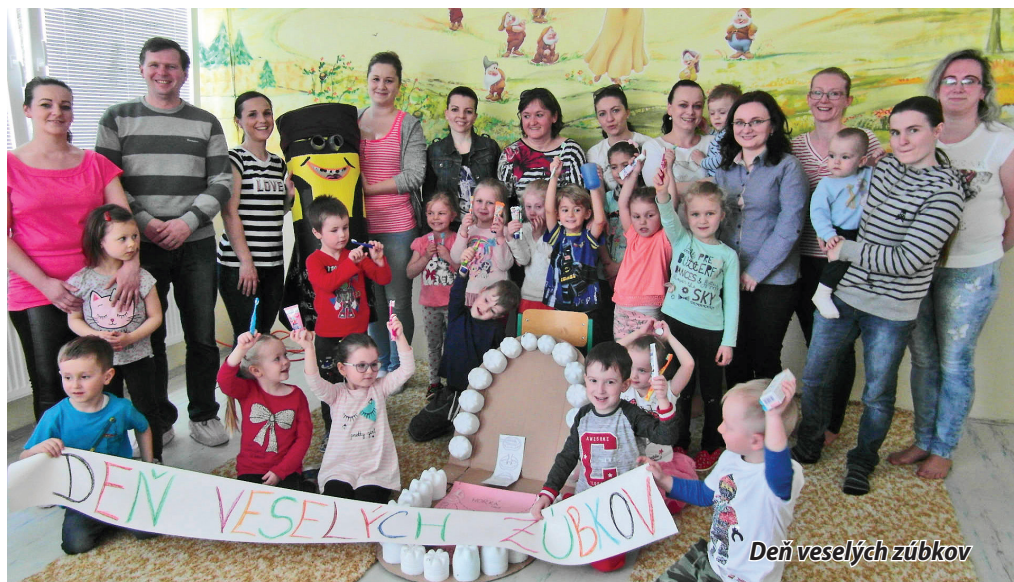
Deň veselých zúbkov