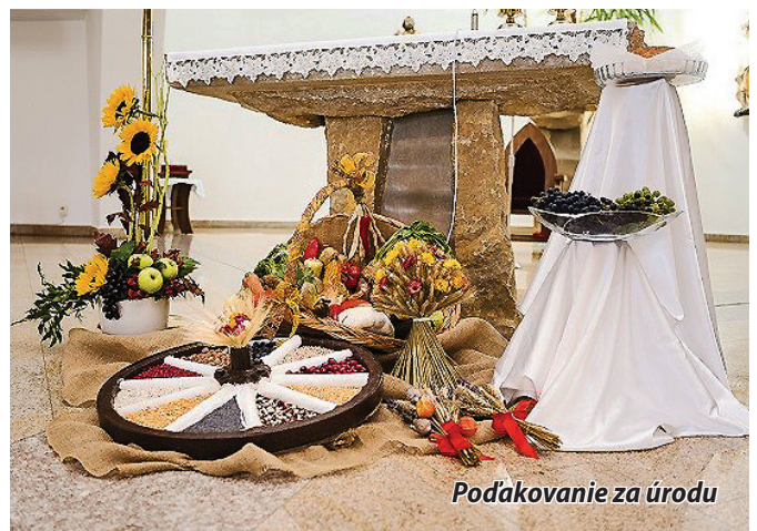
Poďakovanie za úrodu