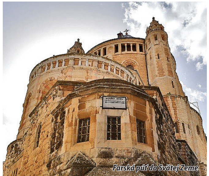
Farská púť do Svätej Zeme