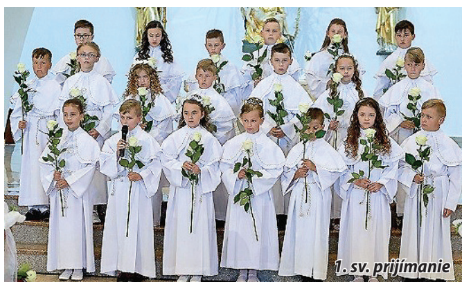
1. sv. prijímanie