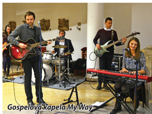
Gospelová kapela My Way

Slávnosť poďakovania za úrodu mala opäť čaro a honosnosť vďaka rukám našich dôchodcov, ktorí sa postarali o výzdobu kostola z vypesto-