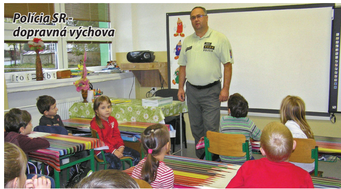
Polícia SR - dopravná výchova