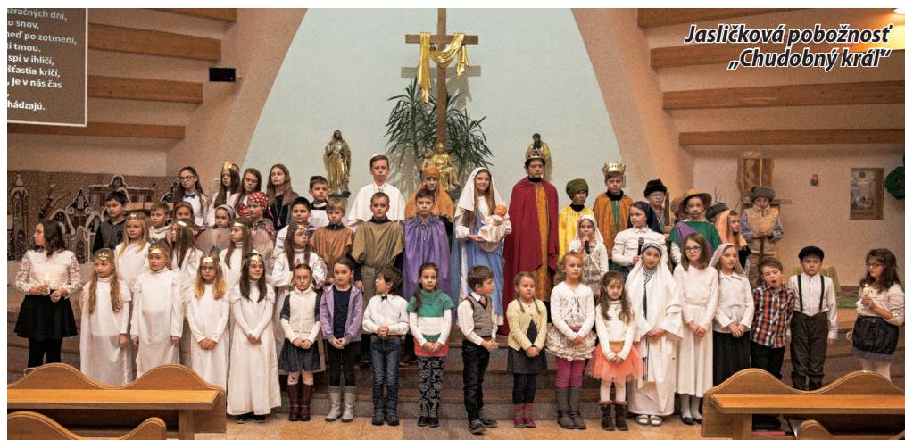
Jasličková pobožnosť „Chudobný kráľ“