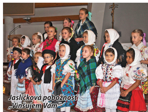
Jasličková pobožnosť „Vinšujem Vám“