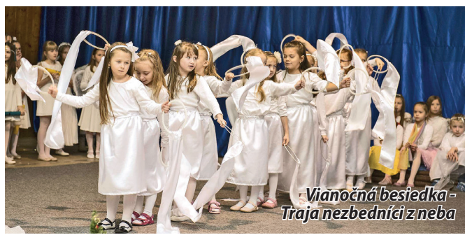
Vianočná besiedka - Traja nezbedníci z neba