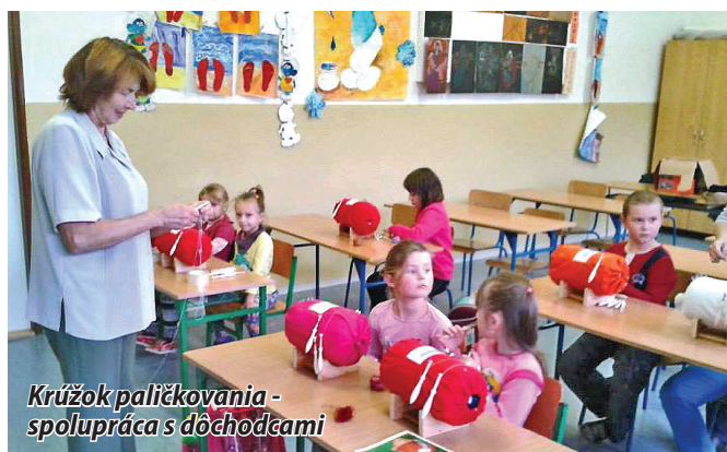
Krúžok paličkovania - spolupráca s dôchodcami