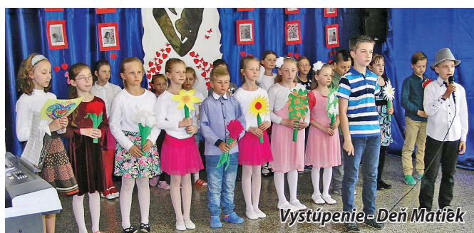
Výstupenie - Deň Matiek