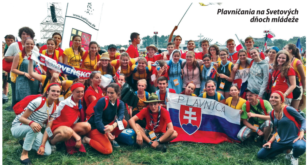
Plavničania na Svetových dňoch mládeže

Aj tento rok zavítal do našej obce Svätý Mikuláš, vypočul si básničky a pesničky od najmenších a na oplátku ich obdaroval skvelými sladkosťami. Zároveň spoločne s deťmi rozsvietil vianočný stromček, ktorý nás s novou vianočnou výzdobou okúzľil vianoč-